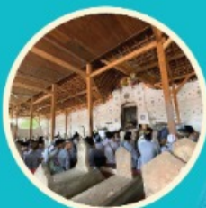
Ziarah Makam Walisongo